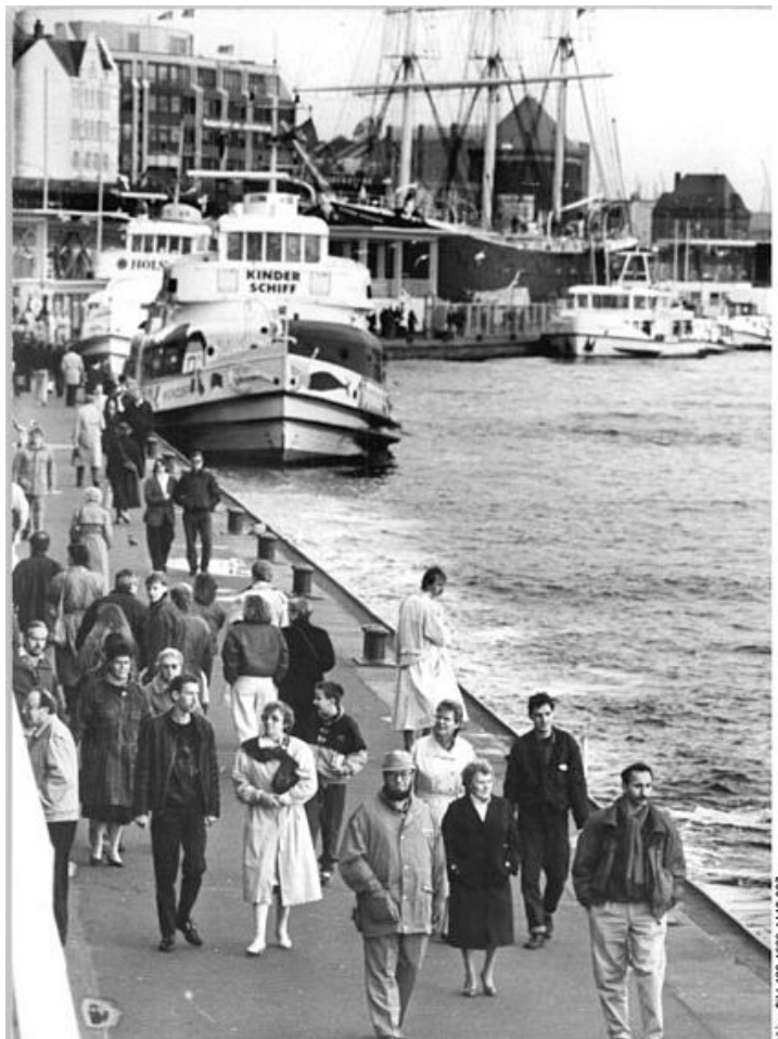
Q 3: Bild: DDR-Bürger in Hamburg 1989

21 Vom DRK 2 vermittelt wurden 3000 Übernachtungen, die von Privatpersonen kostenlos zur Verfügung gestellt wurden. Das Hamburger Abendblatt vermittelte 350 Übernachtungen.