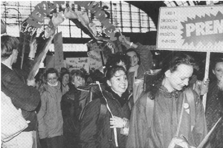
Ankunft des Sonderzugs in Hamburg