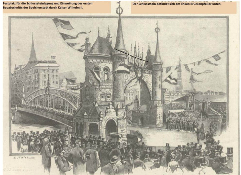
Festplatz für die Schlusssteinlegung und Einweihung des ersten Bauabschnitts der Speicherstadt durch Kaiser Wilhelm II.

lung gelagert, verarbeitet und umverteilt werden konnten. Dazu war der Bau einer Speicherstadt nötig. Auf zwei Elbinseln wurden die Gebäude niedergerissen und über 18 000 Menschen verloren ihre Wohnungen und Werkstätten. Dann wuchsen die Backsteinspeicher in die Höhe. Am 29. Oktober 1888 weihte Kaiser Wilhelm II. diese Bauten an der Brooksbrücke ein. Hamburg trat dem Deutschen Zollverein bei. Ein Hamburger Augenzeuge schrieb später in einem als Broschüre veröffentlichtem Bericht: