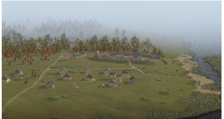
Hammaburg und Siedlung um 845 n. Chr

1 Es war im Sommer, dreizehn Jahre nachdem die Christen gekommen waren. Das Mädchen 2 ohne Namen stand an der Elbe. Sie zog ihr prachtvoll besticktes Kleid aus und stieg in den 3 Fluss. Sie würde nicht frieren. Die große Flussgöttin schenkte ihr Wärme. Sie ließ sich ein 4 wenig treiben. Dann sprach sie das Gebet. „Ich schenke mich täglich dir, große Göttin Elbe, 5 so wie du zweimal täglich zu uns kommst und wieder gehst. Wässere unsere Auen, gib uns 6 Fisch und Getier, heute und jeden Tag. Göttin, ich bin dein. Ich bin du.“ Am liebsten würde 7 das Mädchen ohne Namen sich immer weiter treiben lassen, aber die Hilfesuchenden 8 würden bestimmt bald bei ihrer Hütte im Wald warten. Früher hatte sie am Elbufer gelebt, 9 doch nun musste sie sich verstecken. Seitdem Ansgar und die Christen gekommen waren, 10 war ihr Leben schwierig geworden. Ihr tägliches Bad in der Elbe musste sie weit entfernt von 11 der Siedlung bei der Hammaburg machen. Niemand durfte mitbekommen, dass ein junges 12 Mädchen ohne Kleid im Fluss 13 schwamm. Christenmädchen 14 taten so etwas nicht. 15 Christenmädchen zeigten nie 16 ihre Beine oder Oberarme 17 oder Schultern. Wenn 18 Christenfrauen heirateten, 19 versteckten sie ihre Haare 20 unter Tüchern. Christenfrauen 21 hatten alle ähnliche Namen: